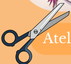
Atelier découpage-collage sur le thème 'printemps'