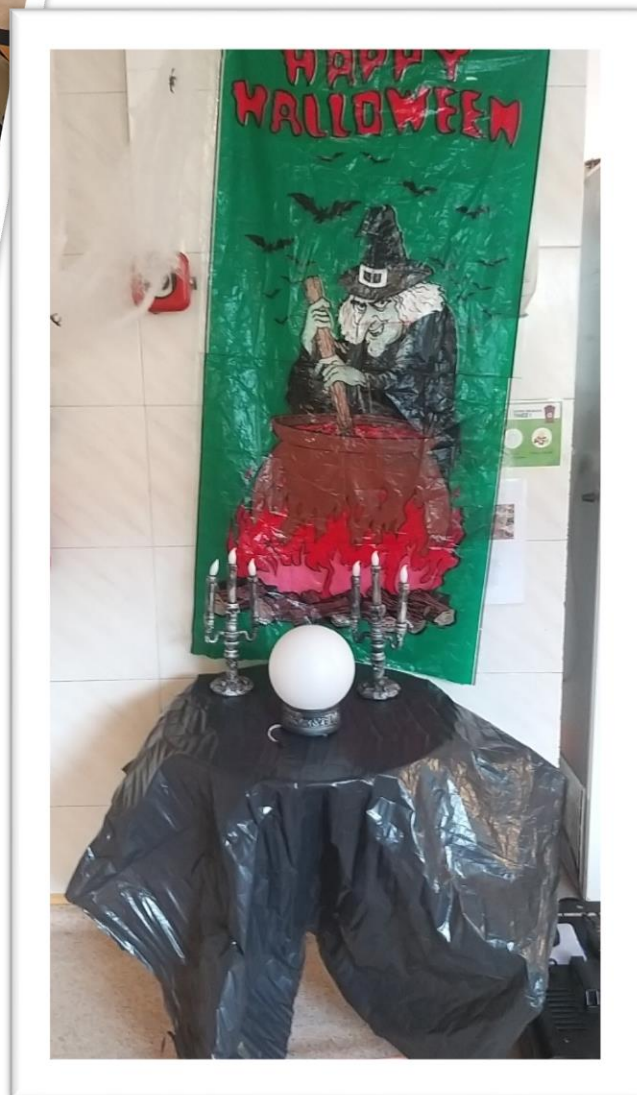
Décoration au top avec la participation de tous !!!!!